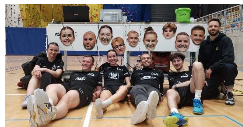
LSP1 – N3

Fin de saison pour les équipes de Rostrenen et des Stermes de Ploubazlanec, qui ont vécu des championnats riches en intensité et en émotions.