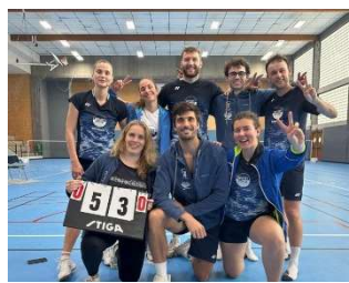
BCR 2 – N2