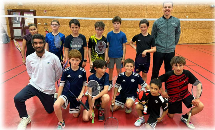
Photo de la visite de la Ligue de Bretagne lors de la séance découverte au CDE le 30 avril 2026

La journée de positionnement permettant d'intégrer le Centre Départemental d'Entraînement sera prochainement organisée le Mercredi 3 Juin 2026 afin d'identifier les joueurs qui composeront le groupe pour la saison à venir