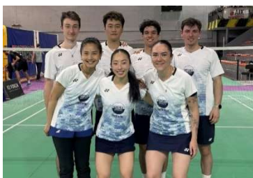
BCR 1 – Top12